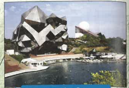
le parc d'attractions Futuroscope