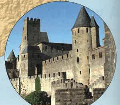
la cité de Carcassonne