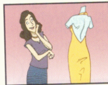
2. ma mère / cette robe