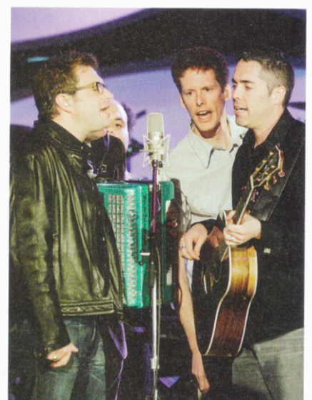
Les membres du groupe Barenaked Ladies