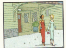
4. Pamela et Caroline

4 L'accident Le mois dernier, Djénaba et Safiatou sont allées au Sénégal. Complétez les phrases au passé composé. Ensuite, mettez-les dans l'ordre chronologique.